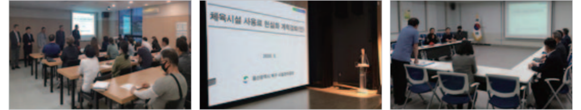
오토밸리복지센터 간담회 쇠부리·국민체육센터 간담회 야구 대관 관련 간담회