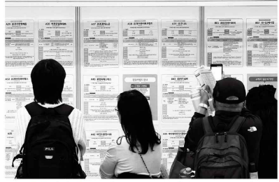
점원들도 이른시간에 일할 곳이다. 27일 서울 강남구 코엑스에서 열린 2026 1차 케어비어(가공) 우수 기업 취업설명회에서 다양한 영생의 생명의 구직자들이 채용정보를 살펴보고 있다.