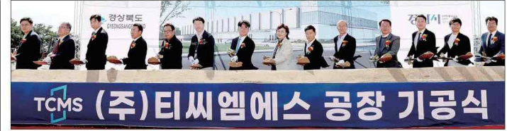
경북도의 벤처 육성 지원을 받아 성장한 티씨엠에스(가) 10일 경산시 진양읍에서 신공장 기공식을 가졌다.

재·도산서원을 함께 걸으며 아정을 마 무리했고, 도산서원에서의 시종과 인 극공연을 통해 퇴계의 뜻을 기렸다. 경북도는 퇴계를 단순한 성리학자 가 아닌, 강남농업 보급과 서원 교육 체계화를 이끈 혁신가로 재조명하고, 그의 지역 자치·인제 양성 정신이 현 재의 '지방시대' 혁신 가치와 맞닿아 있다고 평가했다. 경북도는 이번 행사를 반박 삼아 퇴계 귀향길을 '동양의 산티아고'로 브랜드화하고, 전 세계인이 찾는다 대표 인문학 문화콘텐츠로 육성기로 했다. 서인교 기자