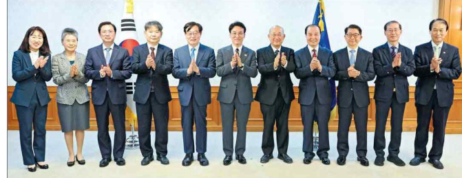
국가보훈위원회들과 기념 촬영하는 김민서 총리. 김민서 국무총리가 27일 서울 중구 정부서울청사에서 열린 국가보훈위원회 위원회에서 위원들과 기념 촬영하고 있다.

특히 문제가 된 '민회' 발행행사는 2021년부터 이어진 동원문화재단의 정기 행사로, 사전에 영덕군선거관리위원회에 정례회 공적성기별 위임이 아나라는 취신을 받은 뒤 진행했다고 설명했다. 따라서 이를 '금권선거'로 보도한 것은 사실관계와 정반대를 나타낸다고 강조했다. 이상현기자