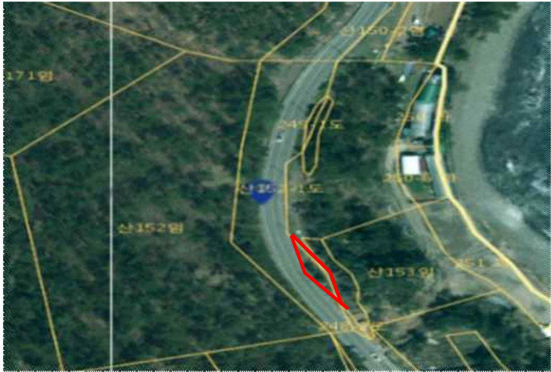
공유재산 무단 점용·사용 현장사진