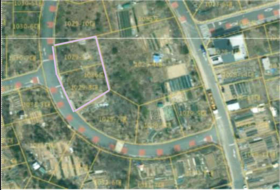
공유재산 무단 점용·사용 현장사진