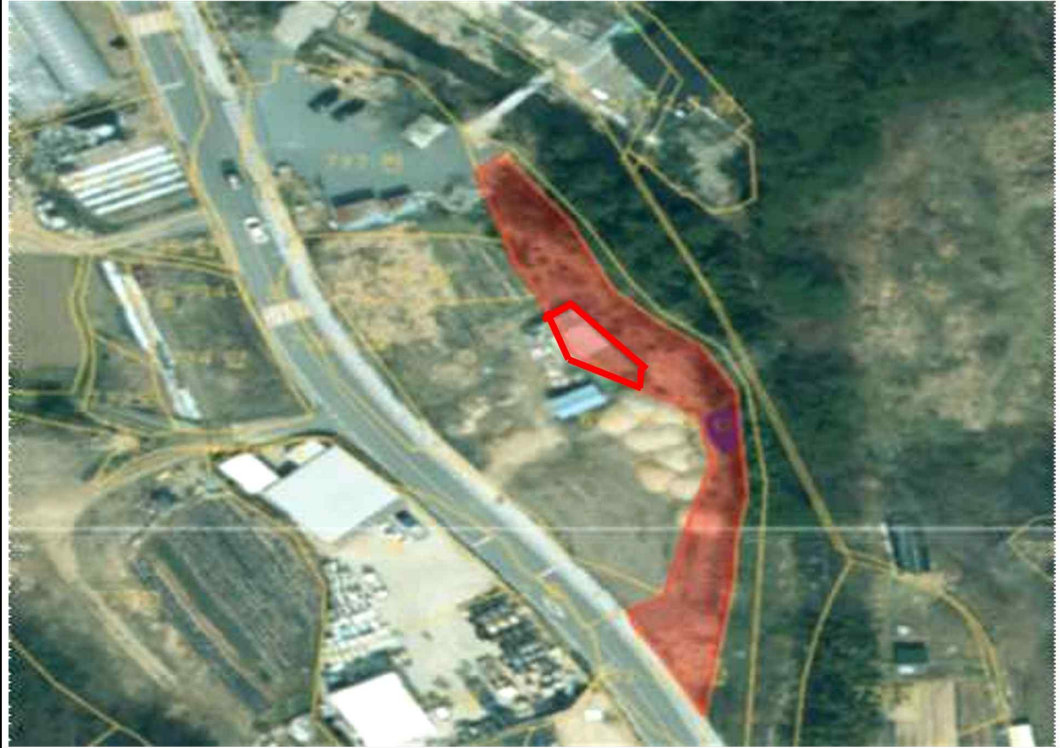
공유재산 무단 점용·사용 현장사진