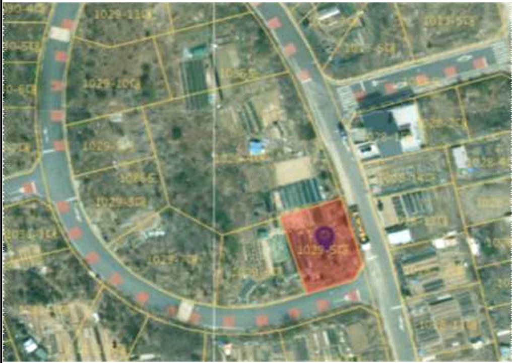
공유재산 무단 점용·사용 현장사진