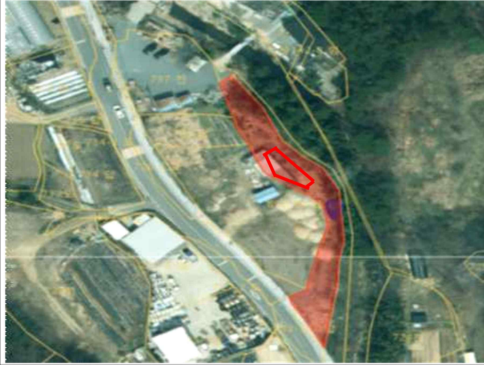
공유재산 무단 점용·사용 현장사진